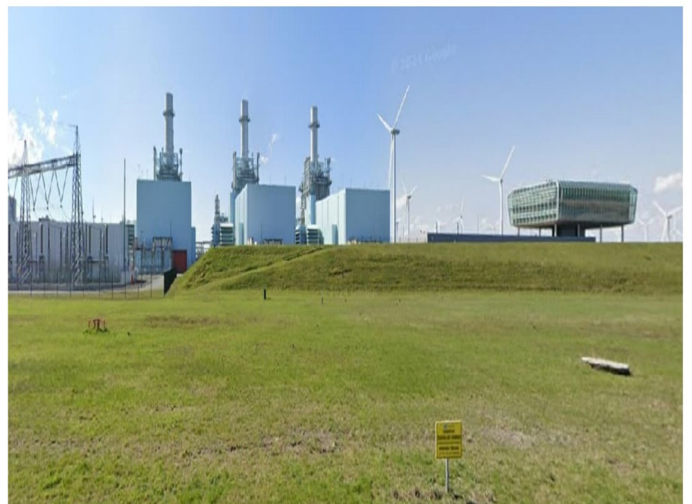
Noordaanzicht bestaande RWE Magnumcentrale