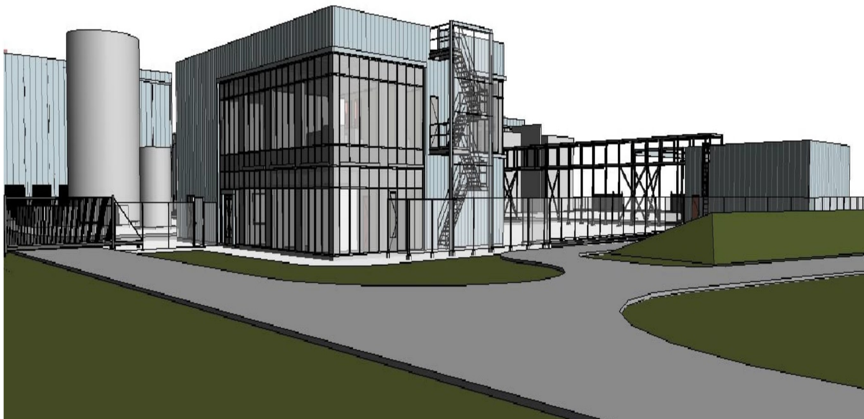
Perspectief Noordoost nieuw