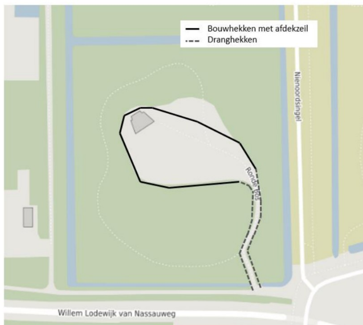
Figuur 1 . Plaatsing van hekken om het bosgebied af te schermen.